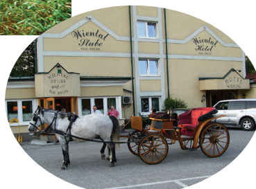
eines unserer Hoteleigenen Lipizzanergespanne