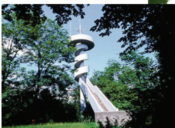
Leopold Figl Warte